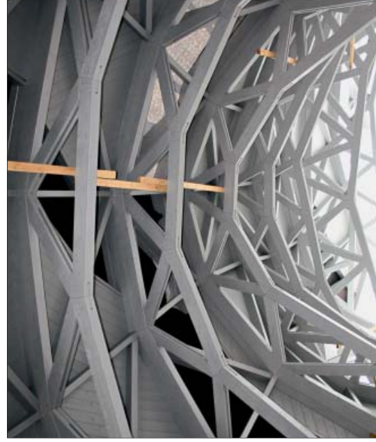
Aus 21 Fachwerkträgern besteht die Haupttragkonstruktion des Tierempiums

Die Konstruktion des Holzgeckos setzt sowohl ebendrig als auch auf den Dächern der Aufmanufaktur auf