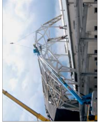
Im Werk vormontierte Teile des Geckoschwanzes, der später frei über den Dächern der Manufaktur schwebt

Die Konstruktion des Holzgeckos setzt sowohl ebendrig als auch auf den Dächern der Aufmanufaktur auf