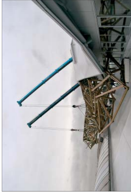
Komplexer Stahlknoten, wie er sich im frei bewitterten Übergangsbereich zwischen Rumpf und Schwanz findet